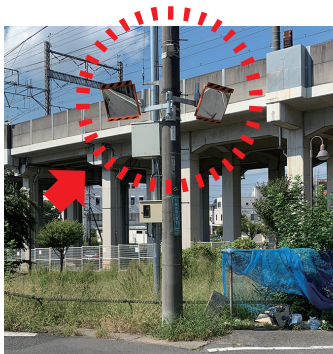
■ 下落合4丁目15番地付