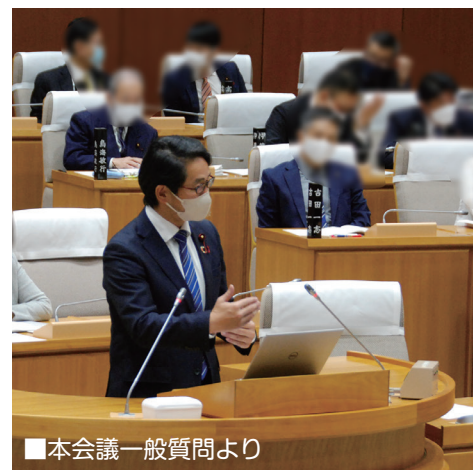
■本会議一般質問より

答弁 鉄道、バス事業者に加え、タクシーや新しい交通サービスの事業者と連携しながら調整を進め、市民の方々が利用しやすいサービスの実現に向けて取り組んでまいります。