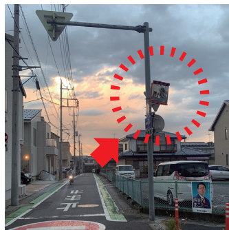
■ 八王子3丁目30番地付近