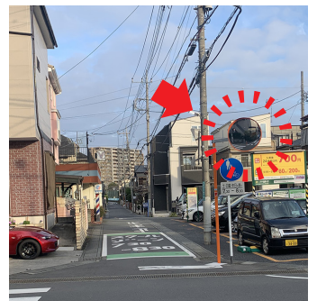
■ 本町東5丁目1番地付近