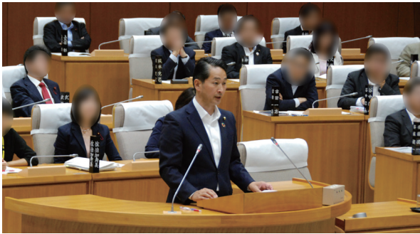
■6/11 さいたま市議会にて初質問いたしました