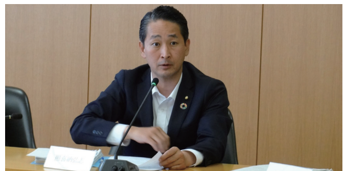
■6/17 さいたま市議会・保健福祉委員会にて質問いたしました