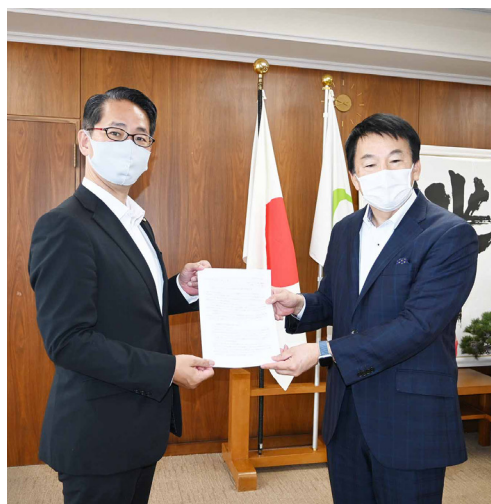
■コロナワクチン緊急要望を市長へ提出

公明党さいたま市議団はコロナワクチンの接種について2度にわたって緊急要望を提出しました。市は要望を受けて、以下のような改善が見られました。