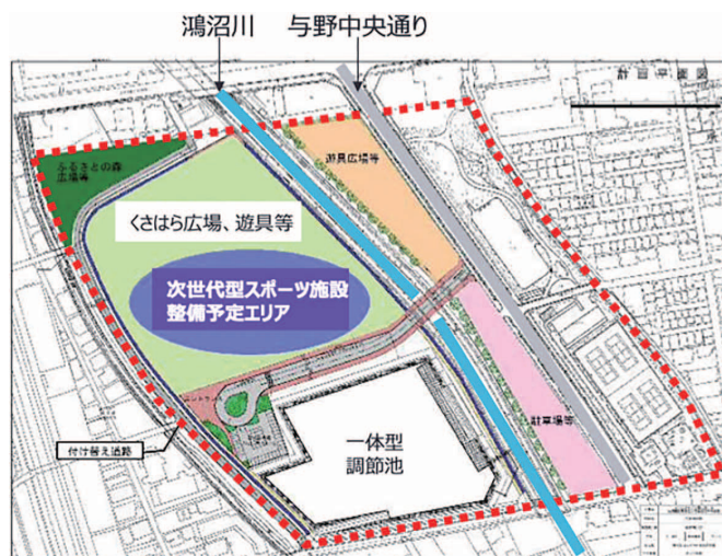
与野中央公園 計画平面図 (R3.9現在)

収容人員5,000人以上のメインアリーナと与野体育館の機能を継承し市民利用を前提としたサブアリーナを有する中規模アリーナ。メインとサブの間にはデジタル技術を活用したイベント、飲食・物販、マルシェ、コミュニティ活動などに利用できる空間が設けられます。